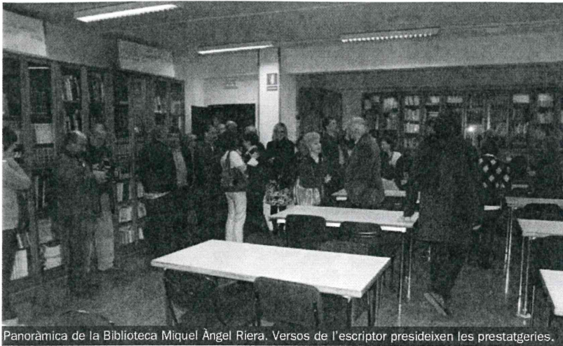
Panoràmica de la Biblioteca Miquel Àngel Riera. Versos de l'escriptor presideixen les prestatgeries.