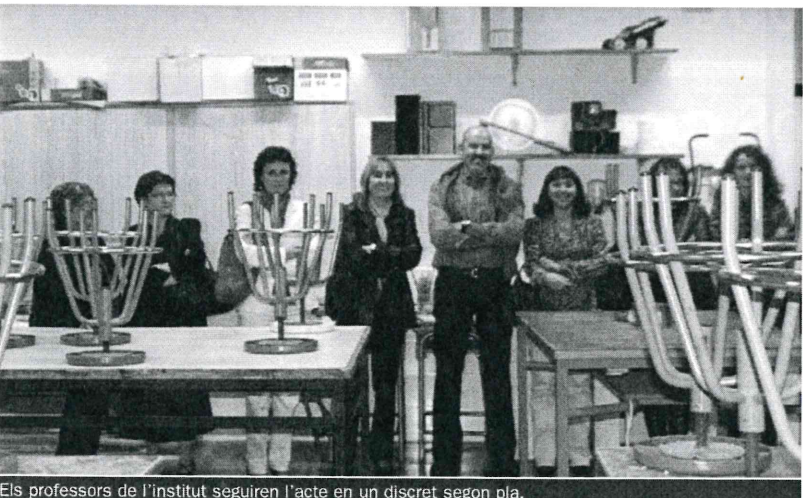
Els professors de l'institut segueixen l'acte en un discret segon pla.