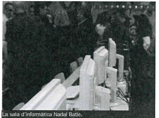
La sala d'informàtica Nadal Batle.