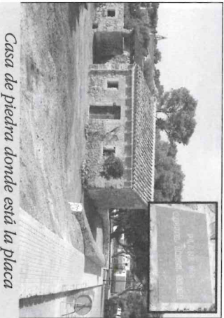
Casa de piedra donde está la placa