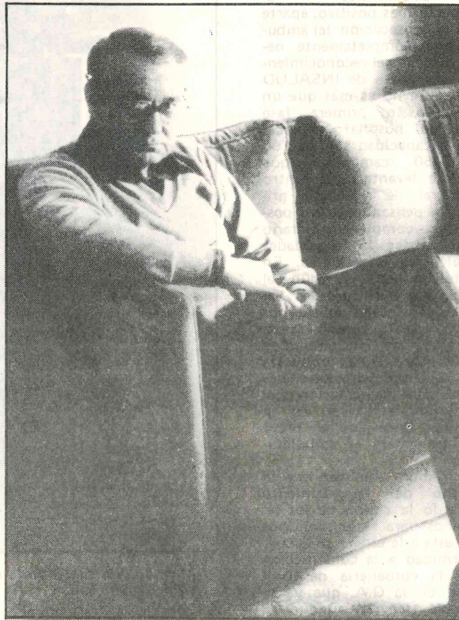
"No me sent un profeta, som un més"

-Una lògica impressió d'altíssima satisfacció pel fet que un llibre meu hagi estat inclòs dins una selecció de 25, d'una literatura que ja té una aportació tan numèrica com de qualitat importantíssima, no podia donar a una altra reacció. Tot i així no me