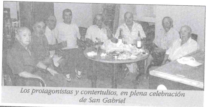
Los protagonistas y contertulios, en plena celebración de San Gabriel

es celebrado personalmente por quien suscribe, por dos motivos. Uno, porque para mí San Gabriel siempre fue y será el 24 de marzo -no me someto a los caprichos del Clero- y, segundo, porque un fatídico 29 de septiembre de 1991, falleció mi padre. Creo que mi rechazo a esa fecha está más que justificado.