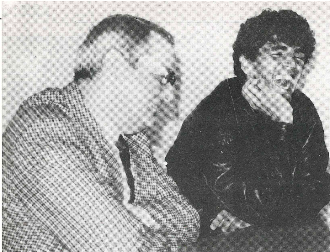
Los dos "Miquel Angels" hicieron gala de su excelente humor en el transcurso de la distendida charla

estos escritos que han pasado por mis manos y que incluyo en la antología poética, en alguno de ellos he visto que su camino es el de las letras, otros en cambio se han quedado estancados y no seguirán este camino. De lo que estoy seguro es que éstos saldrán figuras interesantes dentro de la lírica catalana.