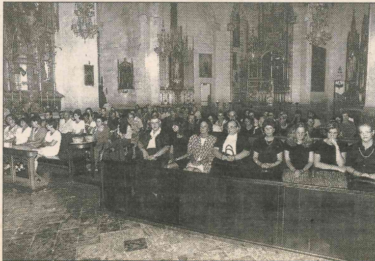
Familiares del escritor. A la derecha, su viuda junto a sus hijas.

un mallorquín universal, los pedagogos seguirán y los antropólogos analizarán "como hijo del Mediterráneo" desde muchos aspectos. Todo esto hay que dejarlo para el tiempo en expresión de Santandreu. "Es el momento de consolar a familia y amigos porque Riera hasta ahora nos ha cautivado pero con su muerte pasa a ser nuestro y vuestro" desde el ámbito en que lo ha conocido cada uno. El rector Miquel Gual ya había aludido al inicio del funeral al hombre "que había sabido cantar las Bienaventuranzas de Dios con el lenguaje de los hombres". Santandreu concluyó su homilía recitándolas ante un auditorio en expresión emocionada por el contenido del mensaje.