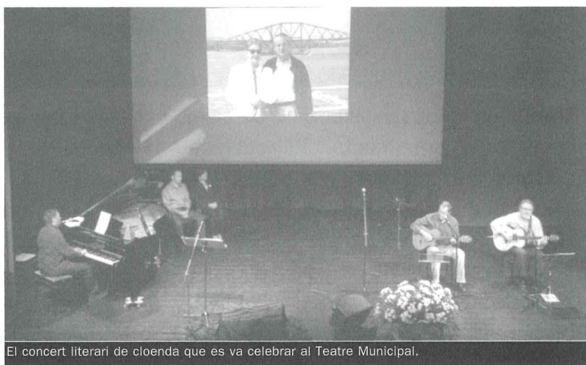
El concert literari de cloenda que es va celebrar al Teatre Municipal.